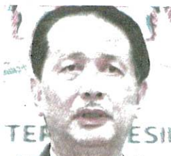
Dr Noor Hisham Abdullah

pat, Kementerian Kesihatan (KKM) mengesan tiga lagi kes positif dalam kluster ini yang semuanya membabitkan warganegara.