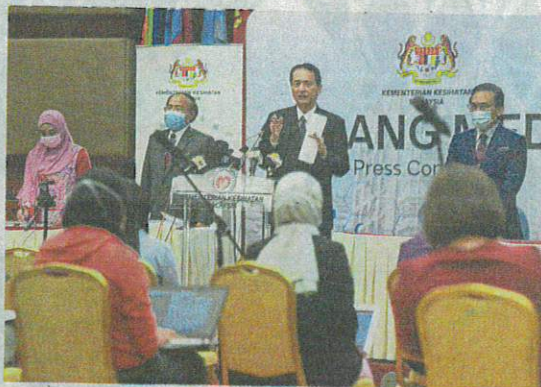
Updating statistics: Dr Noor Hisham speaking during a press conference on Covid-19 at the Health Ministry in Putrajaya.

The Bah Ketil cluster, identified in Baling and Langkawi in Kedah, has recorded nine cases so far.